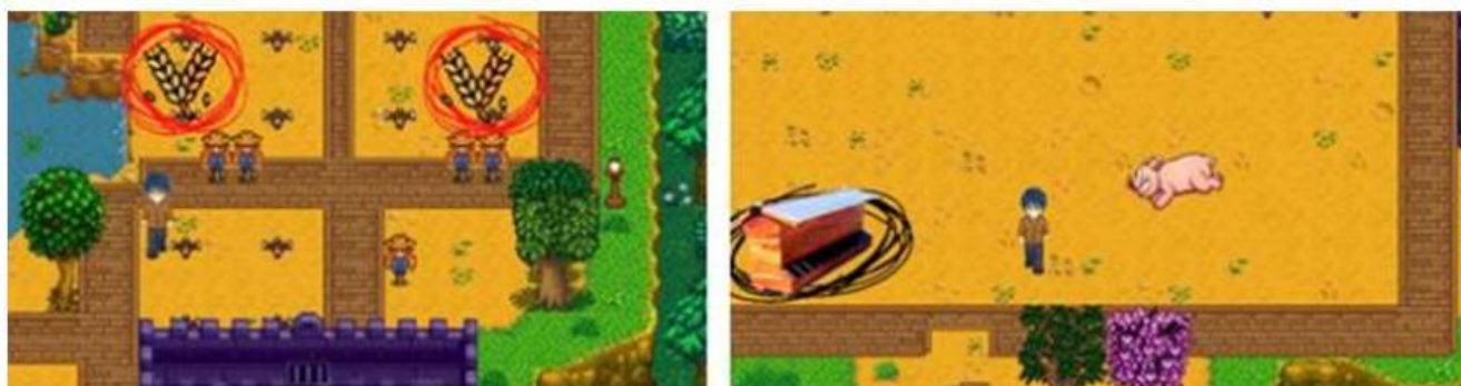
Figura 3. Juego de los cerditos. ( Little pigs game ).

En lo que se refiere al juego desarrollado en Unity (figura 3), se constata que tiene un buen nivel de gráficos y facilidad para jugar, cuenta con varios personajes entre los que destaca el niño granjero y el cerdito, además de una buena animación resultando bastante interactivo. En un primer momento y después de que les fueran proporcionadas a los niños las primeras instrucciones de uso, se constató una buena aceptación del juego. Una vez tenidas en cuenta sus apreciaciones, fundamentadas en el reconocimiento de los personajes y la dinámica del juego se decidió que en futuras versiones se podrían personalizar los personajes lo que mejoraría la animación.