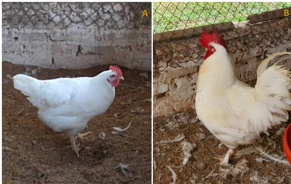
Figura 1. Ejemplares de la Población aviar Rustipollo: A-Hembra y B-Macho ( Specimens of the Rustipollo Avian Population: A-Female and B-Male )

Fue objeto de estudio una población de pollos con características criollas, denominada Rustipollo (Figura 1). Al respecto, se resalta que este genotipo de aves es único en el país, teniendo en cuenta que fue formada inicialmente con fines pedagógicos en la FCV/UNA, y luego, fue procediéndose, buscando potenciar la producción de DP (carne y huevo) en sistemas abiertos o de traspatio.